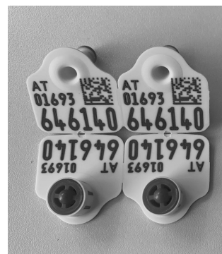
Foto 1 : Musterohrmarken für Schafe und Ziegen mit elf Stellen

Die bekannte Ohrmarke mit dem Ländercode AT für Österreich und den neun Nummernstellen ist in naher Zukunft aufgebraucht. Aus diesem Grund gibt es eine Erweiterung des Nummernkreises von neun auf elf Stellen . Sowohl die visuellen als auch die elektronischen Ohrmarken für Schafe und Ziegen werden in diesem Layout produziert werden: